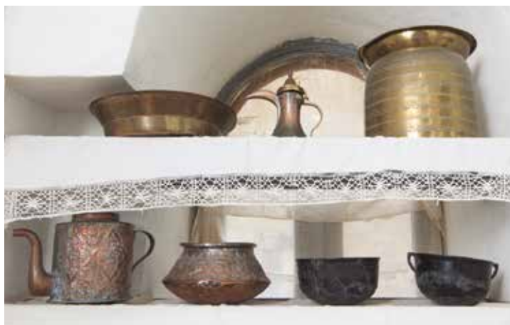
תצוגה במוזיאון.

אלא שבעידן שבו מוזיאונים שינו את מעמדם, ואינם רק בית נכות לריכוז חפצים ופריטים ולשמירה עליהם אלא מקומות מפגש, מרכזי פעילות וחוויה, נדרש גם מוזיאון זה להשתנות. ואכן, כדי להישאר רלוונטי לקהל המבקרים צוות המוזיאון אינו שוקט על שמריו, ופעמים אחדות בשנה מתקיימים מפגשים לסיעור מחות עם הוועדה המדעית והוועדה החינוכית שלו. בשנים האחרונות מנסה צוות המוזיאון להתמודד עם השינויים שהזמן גרם באמצעים שונים, ובהם סיורים תאטרליים ומוזיקליים. סדנאות מספרי סיפורים ומפגשי משוררים במוזיאון הניבו את התערוכות "מוזות במוזיאון" ו"סיפורים יוצאים מן הכלים".