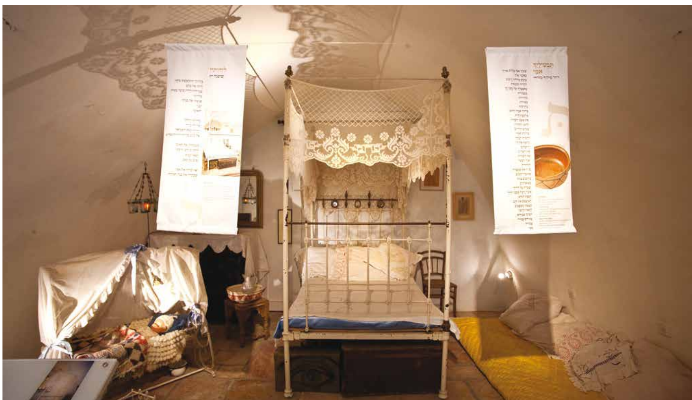
בחדר היולדת. תערוכת "מוזות במוזיאון".