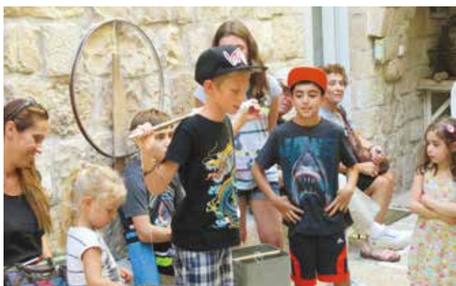
פעילות משפחתית במוזיאון.

את מקומן של הכתוביות הקלסיות החלו לתפוס טאבלטים, המנגישים את המידע למשתמש באופן טוב יותר (אפשר להגדיל ולהקטין את הכיתוב והתמונה בהתאם לצורכי המשתמש). בבניית הפרוגרמה לחידוש פני המוזיאון שנכתבה בחודשים האחרונים הובאו בחשבון בעיות השימור של המבנה והאוסף, התאמה לצרכים המשתנים של קהל המבקרים, התכנים והאיזון הנכון בין הטכנולוגיה לבין יצירת תחושה של זמן שעמד מלכת. בראשית 2016 חודשה תערוכת בעלי המלאכה במוזיאון, המוצגת זה כשני עשורים, ונוספו לה פריטים חדשים. באופן מפתיע, התבוננות בקטלוג המוזיאון מראשית שנות השמונים מראה שלא חל כמעט שינוי בפריטים שהרכיבו את התערוכה, אך אמצעי התצוגה הנוכחיים בה שייכים למאה ה-21.