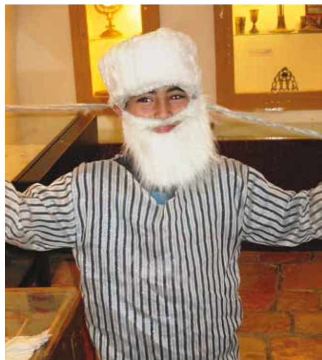
פעילות חינוכית.

אלא שבעידן שבו מוזיאונים שינו את מעמדם, ואינם רק בית נכות לריכוז חפצים ופריטים ולשמירה עליהם אלא מקומות מפגש, מרכזי פעילות וחוויה, נדרש גם מוזיאון זה להשתנות. ואכן, כדי להישאר רלוונטי לקהל המבקרים צוות המוזיאון אינו שוקט על שמריו, ופעמים אחדות בשנה מתקיימים מפגשים לסיעור מחות עם הוועדה המדעית והוועדה החינוכית שלו. בשנים האחרונות מנסה צוות המוזיאון להתמודד עם השינויים שהזמן גרם באמצעים שונים, ובהם סיורים תאטרליים ומוזיקליים. סדנאות מספרי סיפורים ומפגשי משוררים במוזיאון הניבו את התערוכות "מוזות במוזיאון" ו"סיפורים יוצאים מן הכלים".